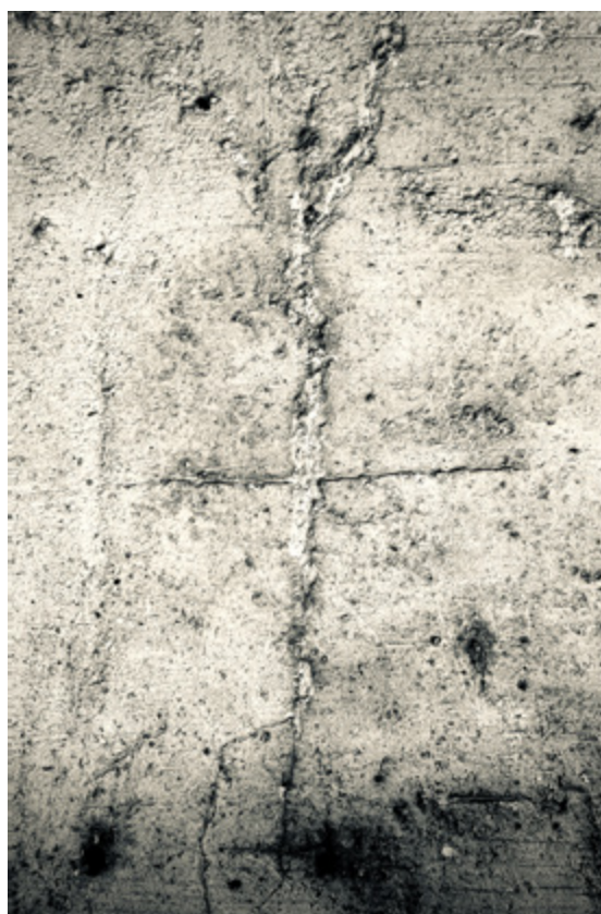
Claude Baudin Estampe numérique (2022)

( Feuillotez le début du livre sur labaraquedechantier.org )