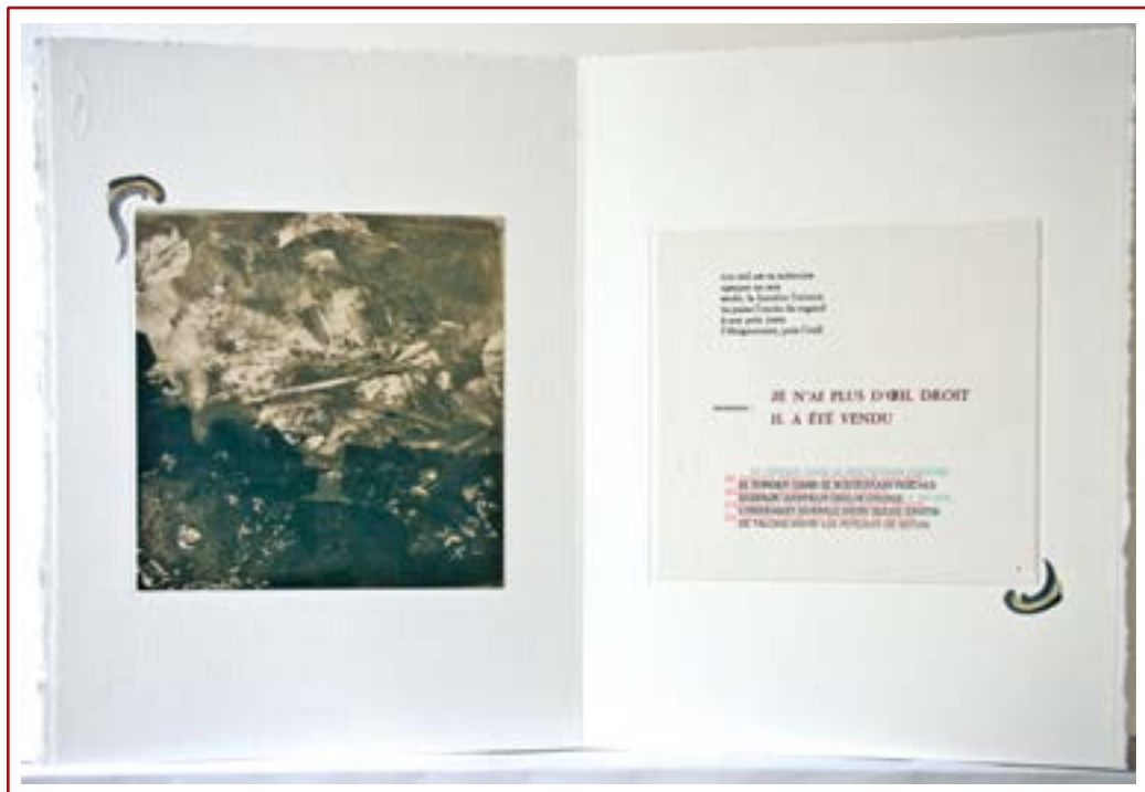
Figures Fugitives. Exemple unique 30x40. 2019