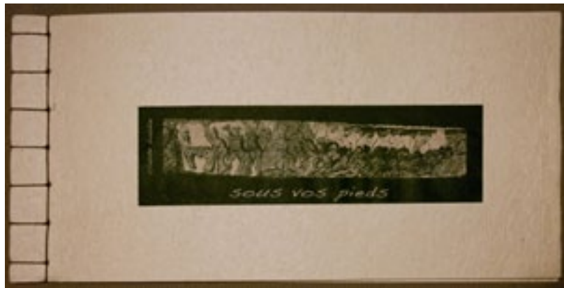
Claude Baudin. Sous vos pieds. Livre d'artiste. 6 exemplaires. 2015